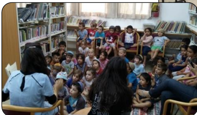
שעת סיפור לילדי הקייטנות יולי 2016