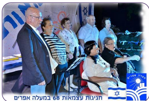
חגיגות עצמאות 68 במעלה אפרים