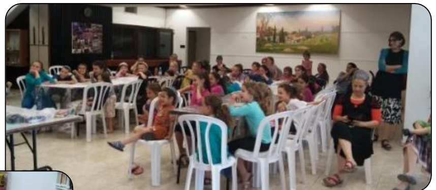
סדנת בובנאות מאי 2016