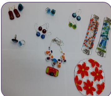
תוצרים מסדנת הזכוכית