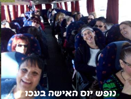
נופש יום האישה בעכו