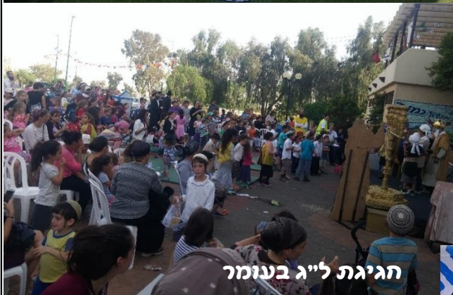
הגיגת לייג בעומר