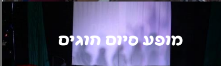
מופע סיום חוגים