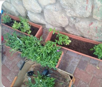
שותלים תבלינים ופרחים