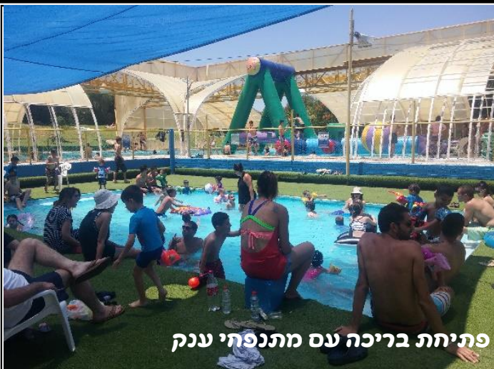
פתיחה בריכה עם מתנפחי ענק